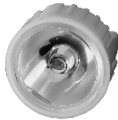
Reflektor til diode. Reflektor till diod.