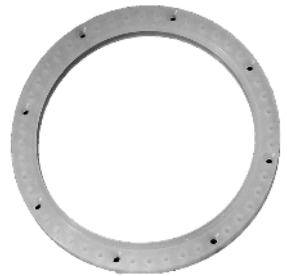
Silikonepakning. / Silikonpackning.