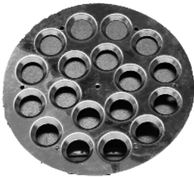
Beskyttelsesplade. / Skyddsplatta.