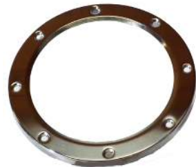
Låsering. / Låkring