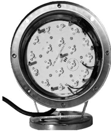
Printplade med LED dioder (Kan ikke udskiftes). Kretskort med LED dioder (kan inte bytas).