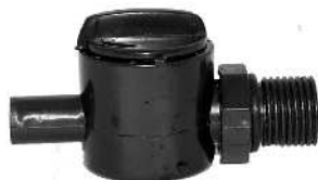
Hane / Reglervred