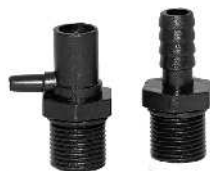
Slangestudser / Slangkopplingar