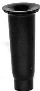
Fontænedyse KLOCKE Fontänmunstycke KLOCKA