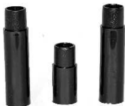
Forlængerrør / Förlängningsrör