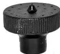
Fontænedyse VULKAN Fontänmunstycke VULKAN