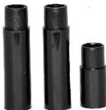
Forlængerrør / Förlängningsrör