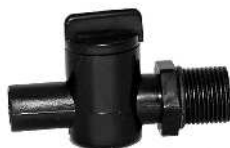
Hane / Reglervred