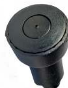
Fontænedyse VULKAN Fontänmunstycke VULKAN