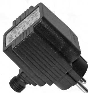
Udendørs transformator Uttomhus transformator