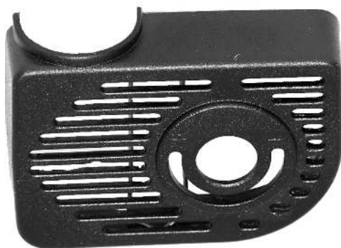
Filterhus / Filterkåpa

En defekt pumpe må ikke lægges i den normale dagrenovation, men skal indleveres på en af hjemkommunens genbrugspladser for el-materiel f.eks. en miljøstation.