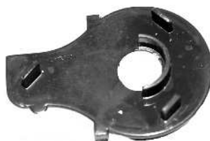
Rotorlåg / Rotorlock