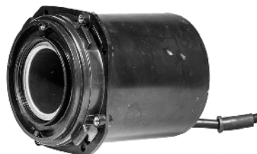
Pumpemotor / Pumpmotor