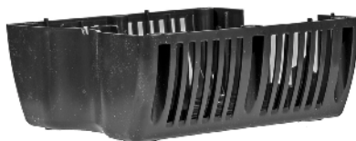
Nederste filterkammer / Undre filterkåpa