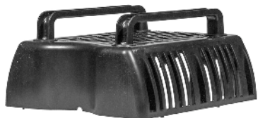
Øverste filterkammer / Övre filterkåpa