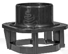
Rotorkammer / Rotorlock Art.nr. 30779